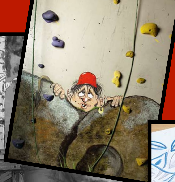
De lekfulla motiven i äventyrshuset Boda Borg är till största del målade på fri hand efter idéskisser på papper.